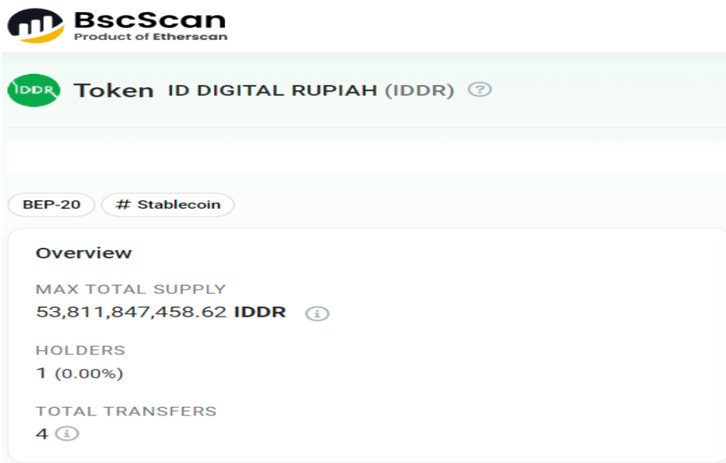
Gambar C. Screenshot bscscan untuk IDDR BEP-20 (30 September 2023)/ Figure C. Bscscan Screenshot for IDDR BEP-20 (September 30, 2023)